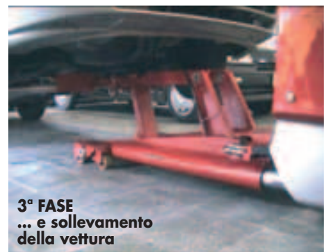
3° FASE ... e sollevamento della vettura