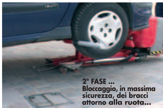
2° FASE ... Bloccaggio, in massima sicurezza, dei bracci attorno alla ruota...