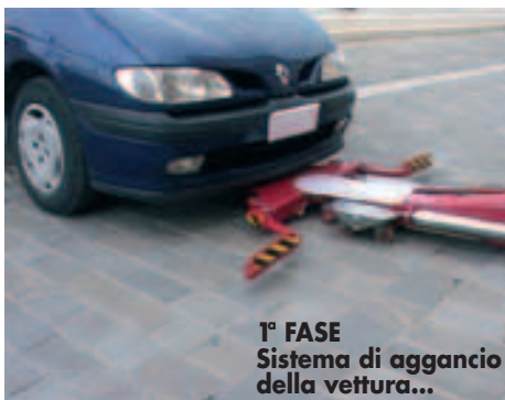
1° FASE Sistema di aggancio della vettura...